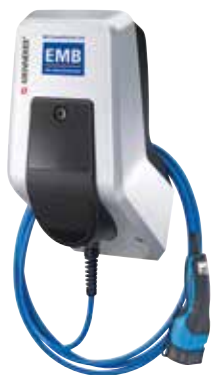
Variante A AMTRON® Start

Es stehen Ihnen zwei Typvarianten der Firma MENNEKES zur Auswahl: